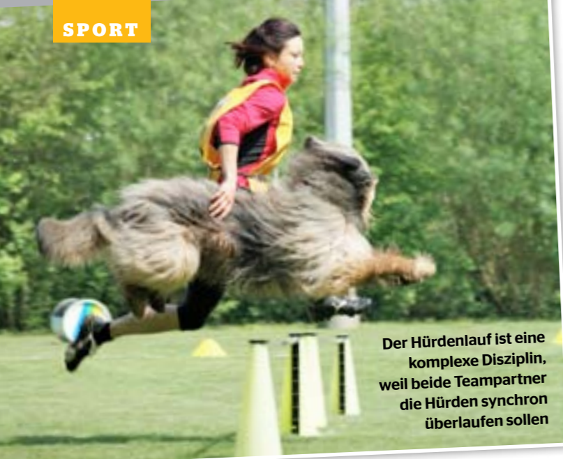
Der Hürdenlauf ist eine komplexe Disziplin, weil beide Teampartner die Hürden synchron überlaufen sollen