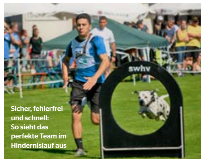
Sicher, fehlerfrei und schnell: So sieht das perfekte Team im Hindernislauf aus