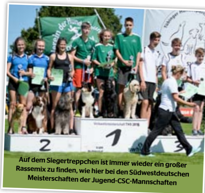
Auf dem Siegereppchen ist immer wieder ein großer Rassemix zu finden, wie hier bei den Südwestdeutschen Meisterschaften der Jugend-CSC-Mannschaften