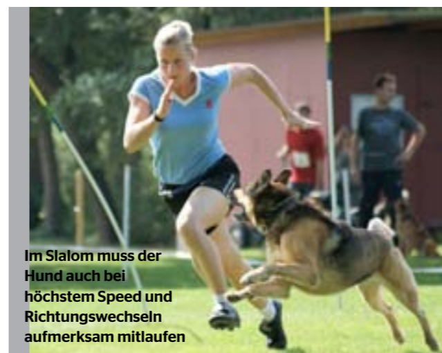
Im Slalom muss der Hund auch bei höchstem Speed und Richtungswechseln aufmerksam mitlaufen

gehören vor dem Training ebenso Einlaufen, Dehnen und Steigerungsläufe von beiden Teampartnern dazu.